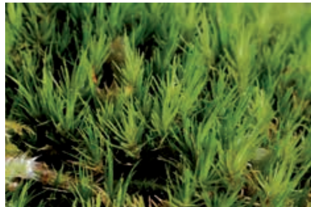
Abb. 1: Grünes Besenmoos ( Dicranum viride ).

Fast alle Moose-Arten sind im Gelände nur durch Experten sicher zu bestimmen. Selbst erfahrene Bryologen müssen bei jeder Kartierung zahlreiche Proben