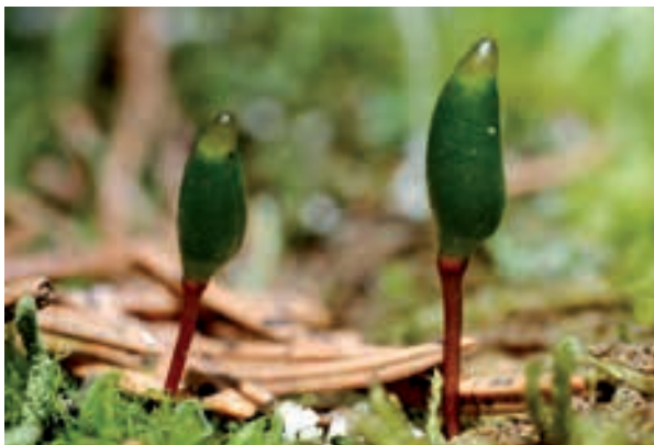
Abb. 4: Grünes Koboldmoos ( Buxbaumia viridis ).