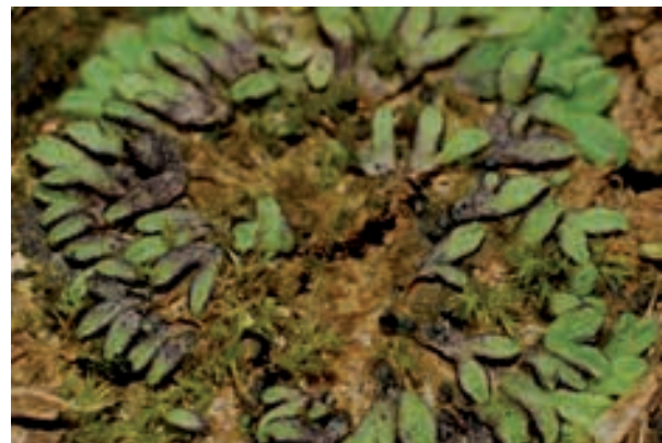
Abb. 5: Das Sternlebermoos Riccia wernstorffii .