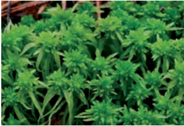
Abb. 2: Das Torfmoos Sphagnum fimbriatum .